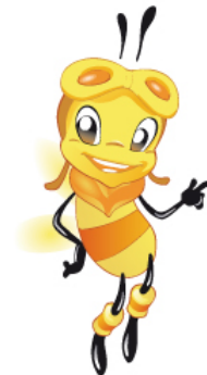
Kellogg Deutschland Illustration der Loop-Bienen Charaktere für eine Sticker-Promotion