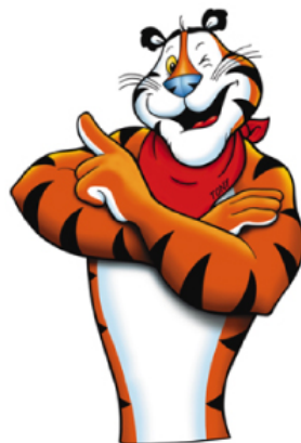
Kellogg Deutschland Illustration der klassischen Kids Characters: Tony, Coco, Smacks, Chocos, etc. für Packungen und Promotions