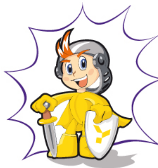
BKK Entwicklung eines Sympathieträgers für eine Krankenversicherung