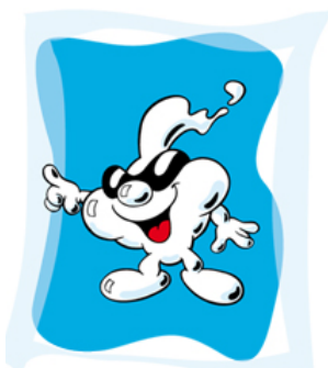
Henkel Schauma Kids, Figurenentwicklung des Lead Characters "Bubble-Joe" (für Agentur)