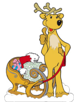
Mitsubishi Pajero Pinin Markteinführung, Figurenentwicklung für Aufsteller, Aufkleber, Plakate (für Agentur)