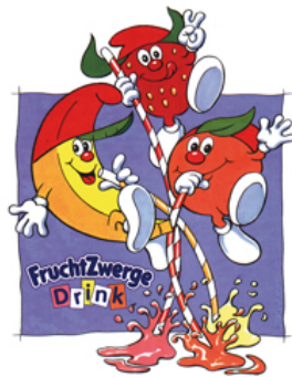
Danone Fruchtzwerge. Illustration der bereits bestehenden Figuren für diverse Promotionaktionen (für Agentur)