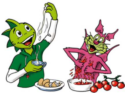
AOK-Krankenkasse Illustration der Lead-Charaktere Jolinchen und Schrilli für Printobjekte, Give-aways, Walking-acts, Internet, etc.