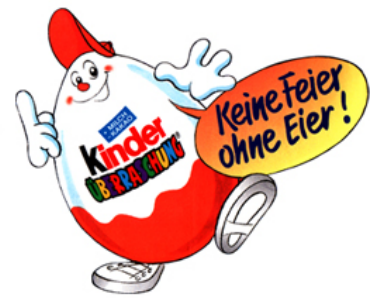
Ferrero Kinder Überraschung, diverse Promotion- und Packungsentwicklungen (für Agentur)