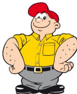
Euroshell Entwicklung des Characters für eine LKW- Fahrer Zeitung, Comic, SLO, Aufblasfigur, etc. ( für Agentur )