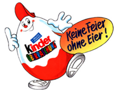
Ferrero Kinder Überraschung, diverse Promotion- und Packungsentwicklungen (für Agentur)