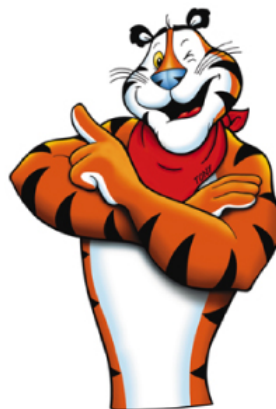
Kellogg Deutschland Illustration der klassischen Kids Characters: Tony, Coco, Smacks, Chocos, etc. für Packungen und Promotions