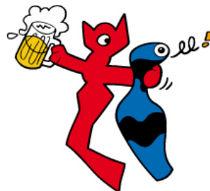
Max & Rüdiger Zwei Freunde die gemeinsam die Abenteuer des Alltags bestreiten. (Freie Arbeit)