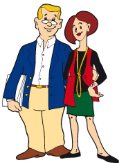
IBU Figurenentwicklung Buchhändler- pärchen für IBU- Broschüre und Messe- aufsteller( für Agentur )