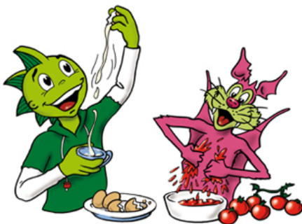
AOK-Krankenkasse Illustration der Lead-Charaktere Jolinchen und Schrilli für Printobjekte, Give-aways, Walking-acts, Internet, etc.